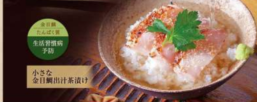
小さな 金目鯛出汁茶漬け